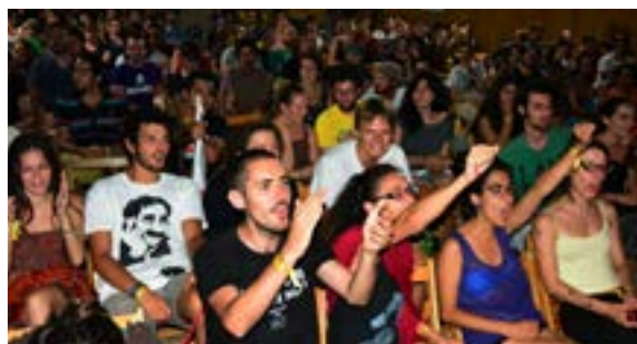
Fjärde Internationalens årliga sommarläger där unga kamrater möts, lär och festar.

Intresserad och vill veta mer? Kontakta: info@socialistiskpolitik.se