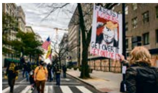
LEDARE: Mot neofascismen Sid 2