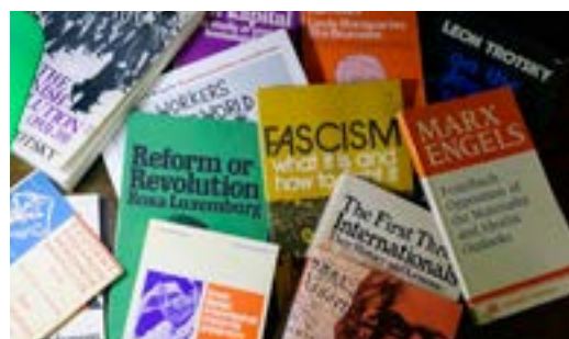
STUDIER om socialismen Sid 7