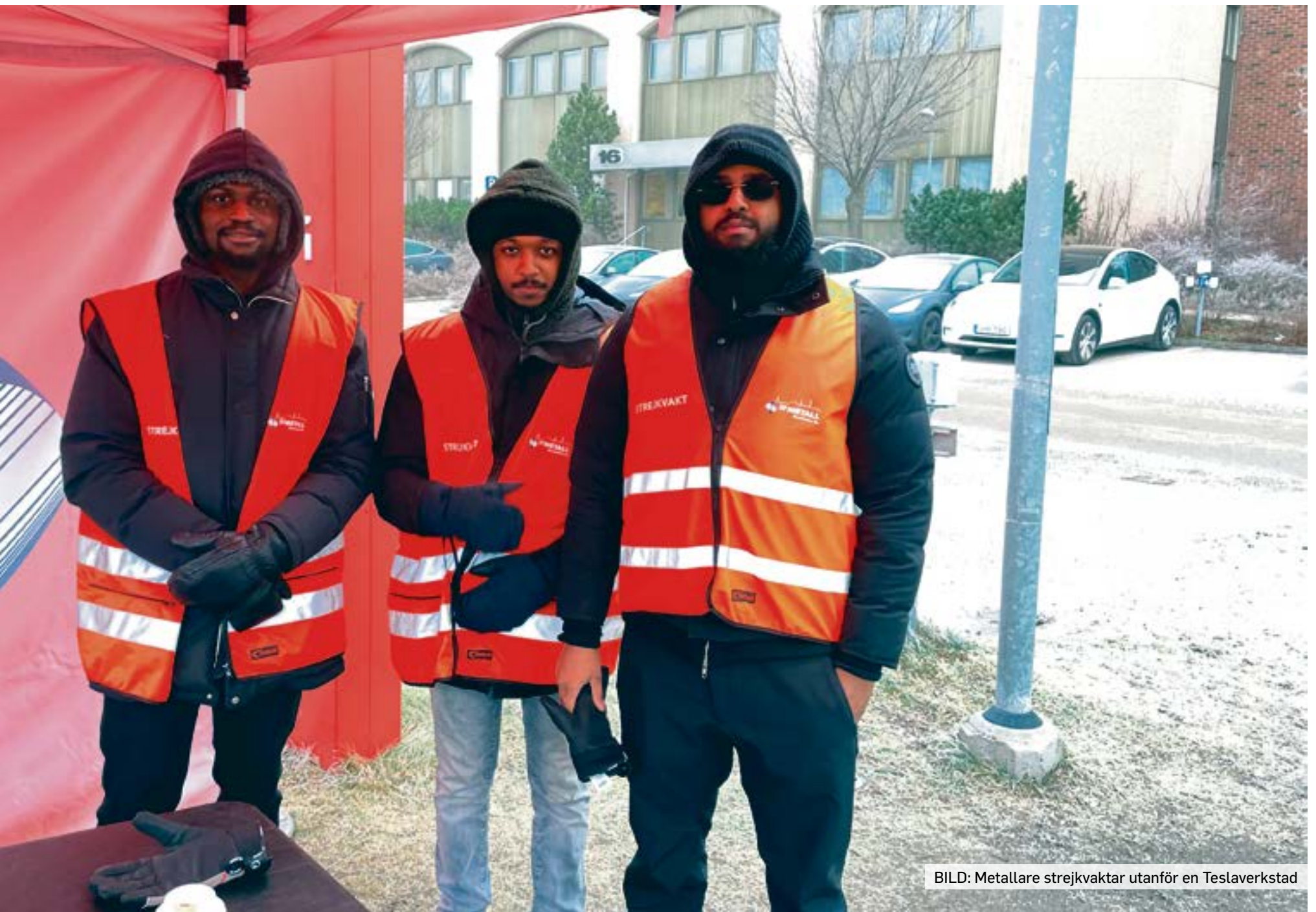
BILD: Metallare strejkvaktar utanför en Teslaverkstad

demokratiska principer". Att Israel vägrat rätta sig efter Internationella Domstolen i Haag, bedriver dagliga terror mot civila och medvetet dödar barn, biståndsarbetare och FN-personal – det spelar tydligen ingen roll. Affärerna fortsätter som vanlig. Därmed är EU:s regeringar – även den svenska – medskyldiga. För låt oss vara tydliga: det är inget krig som pågår – det är ett folk-mord. Det blir ingen fred i Mellanöstern förrän Palestina är fritt och alla människor "mellan floden och havet" tillerkänns lika mänskliga rättigheter. Och Palestina kan inte bli fritt så länge apartheidstaten Israel backas upp av regeringarna i USA och EU. Bryt associeringsavtalet! Bojkotta Israel!