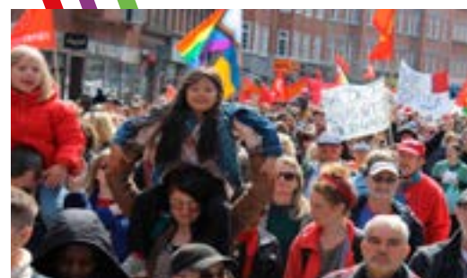
MANIFEST: Istället för krigsrustning