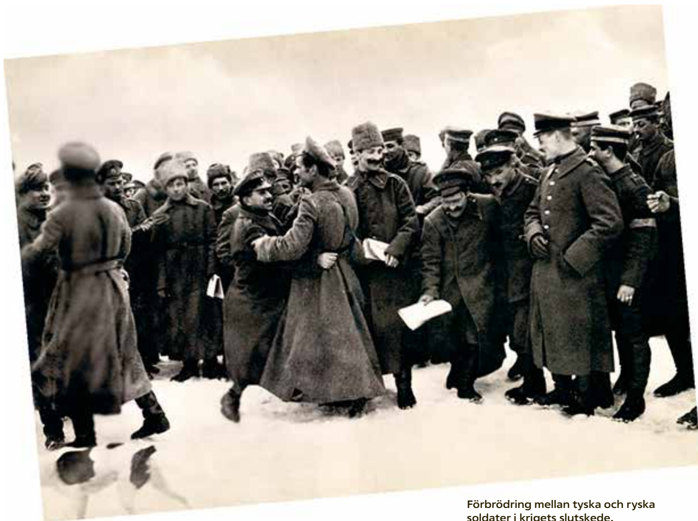
Förbrödning mellan tyska och ryska soldater i krigets slutskede.

Dessa omständigheter är orsaken till att den internationella arbetarrörelsen, även de delar som inte blev offer för den nationella paniken under den första tiden efter krigsutbrottet – ännu i folk mordens andra år – inte funnit några medel och vägar till en samtidig, kraftfull kamp för freden. I denna olidliga situation möts vi, representanter för socialistiska partier, för fackföreningar eller minoriteter inom dessa. Vi tyskar, fransmän, italienare, ryssar, polacker, letter, rumäner, bulgarer, svenskar, norrmän, holländare och schweizare, möts här – inte som representanter för den nationella solidariteten med exploatörerna – utan som talesmän för den internationella arbetarsolidariteten och för klasskampen. Vi